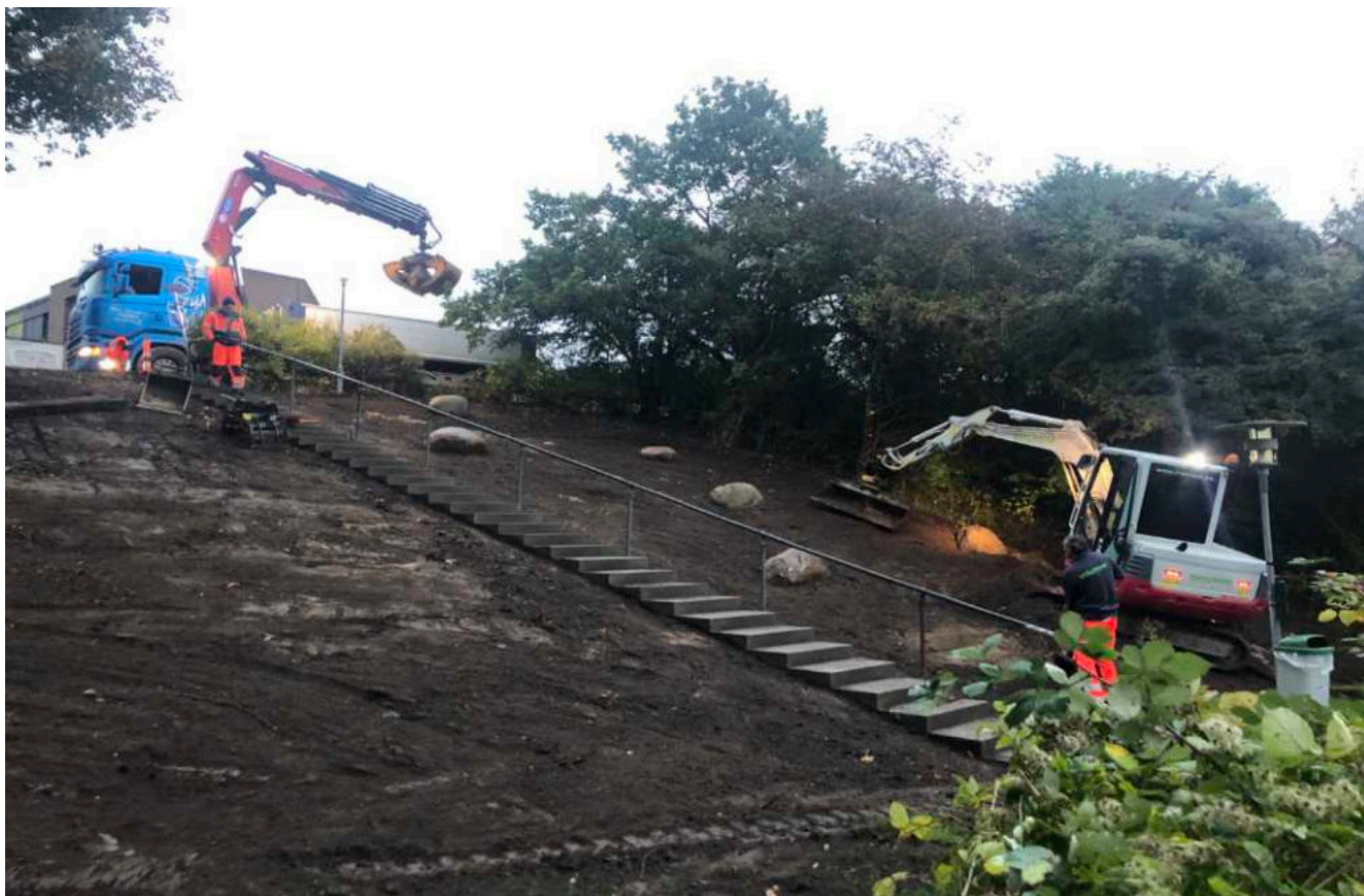
Elefantrappen er blevet noget helt andet