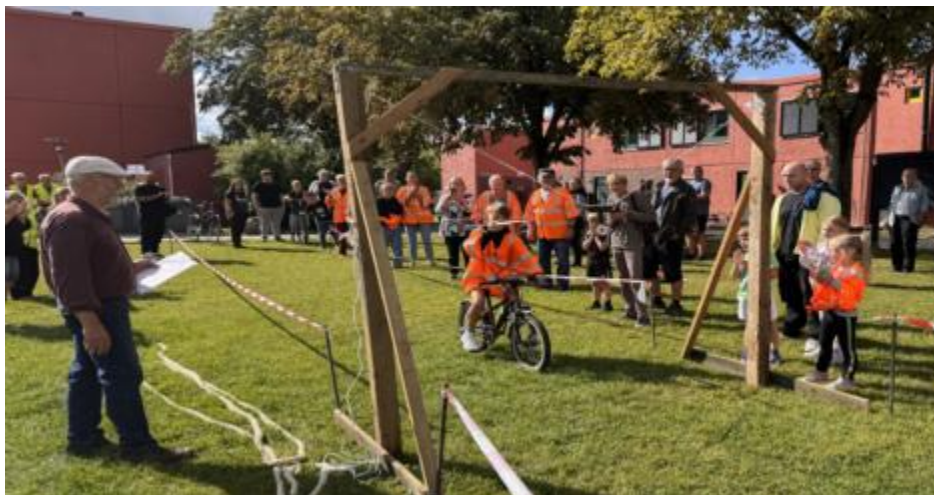
Cykelringridning fra sidste års 5-kamp

I 2025 vandt Slipperne Hyldespjældsmesterskaberne i 5-kamp. Alle (på nær dem der bor i Slipperne) ved selvfølgelig, at det var en fejl 😊. Det skal ikke ske igen, og det har Stræderne og Længerne/St. Torv nu mulighed for at sørge for, at det ikke gør. For i forbindelse med 50-års jubilæet den 29.8. arrangerer vi 5-kamp igen, og så får Stræderne og Længerne/St. Torv en chance for revanche – hvis altså ikke Slipperne stikker en kæp i hjulet for dem.