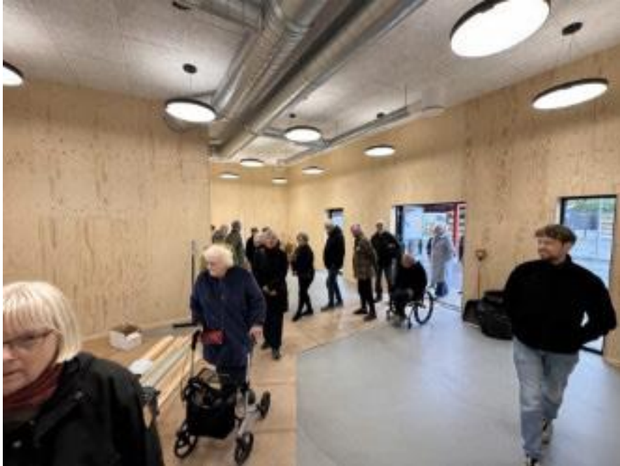
Fra åben byggeplads på genbrugsgården den 11.5

Omkring månedsskiftet august/september (plus-minus) flytter vi Genbrugsgården tilbage til udgangspunktet: Materialegården på Strædernes P-plads. Vi glæder os til at kunne tilbyde bedre rammer for affaldssortering og genbrug, og vi glæder os til de nye muligheder, værkstederne får.