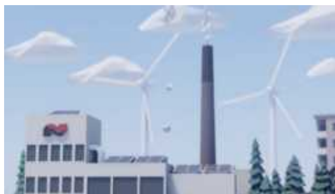
Både strøm fra vindmøller og solceller kan bruges til lavtemperaturfjernvarme.

Vi kan derfor godt være stolte i Albertslund over, at vi er de første i Danmark, der får udrullet lavtemperaturfjernvarme i hele byen.